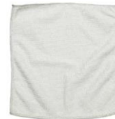
KETERANGAN Kain Mikrofiber